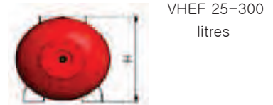
VHEF 25-300 litres